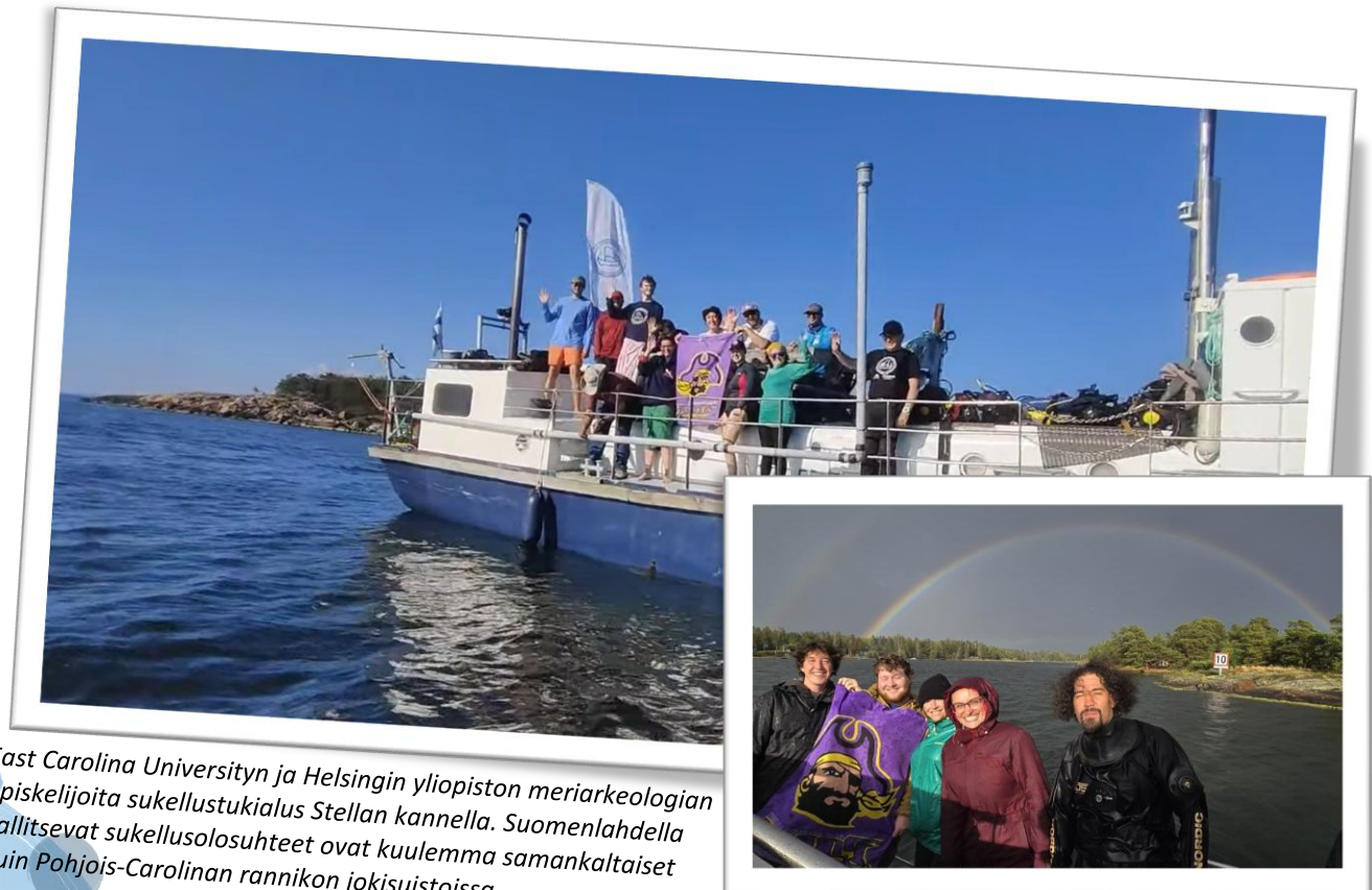
East Carolina Universityn ja Helsingin yliopiston meriarkeologian opiskelijoita sukellustukialus Stellan kannella. Suomenlahdella vallitsevat sukellusolosuhteet ovat kuulemma samankaltaiset kuin Pohjois-Carolinan rannikon jokisuistoissa.