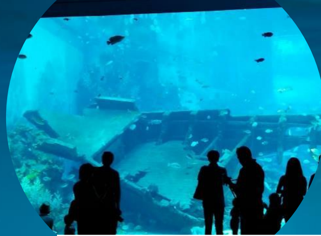
Hylky- & Itämeriakvaario(t)