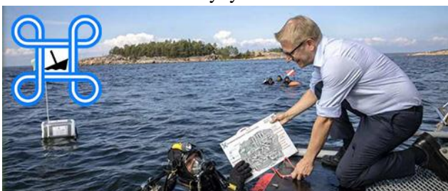
2. Ent. ministeri Tiilikainen avaa Hylkypuiston 3.9.2018.

Unohdettujen taisteluiden tapahtumien ja niissä koettujen menetysten selvittämiseksi tieteen tekijät ovat yhdessä päättäneet tutkia Suomen suosituimpien hylkysukelluskohteiden todelliset tarinat nykyaikaisin tieteellisin menetelmin. Tätä varten on organisoitu Suomen historian kenties laajin ”sukelluslaivasto” Porkkalan Hylkypuistoon reiluksi viikoksi. Ne toimivat sukellustukialuksina yli kolmellekymmenelle vapaaehtoiselle sukeltajalle, jotka tutkivat ja dokumentoivat hylkyjä ja niissä olevaa esineistöä kuten tykkeitä, niiden lavetteja ja ampumatarvikkeita.