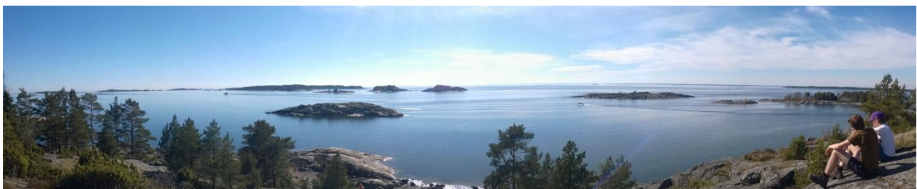
5. näkymä Porkkalan Pampskatanin kallioilta Hylkypuiston saaristoon