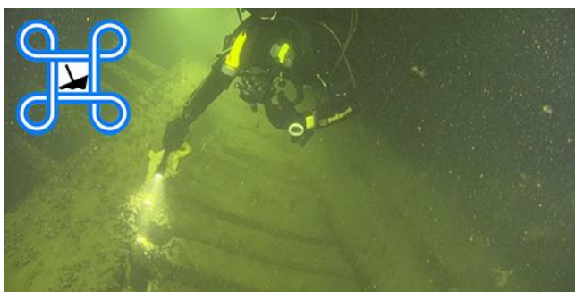
1. Sukeltaja tutkii hylkyä ja puhuu pintaan ultraäänipuhelimella.

Suomen meriarkeologisen seuran tutkimuksissa on paljastunut, että Porkkalan Hylkypuistossa on lukuisia sotalaivojen hylkyjä lähes kaikista tunnetuista sodistamme ja lisäksi satoja vuosia vanhoja sota-alusten hylkyjä, joihin liittyvät taistelut ovat jo kauan sitten unohtuneet. Vain pohjassa makaavat tykit ja hylkykappaleet kertovat unohdetuista taisteluista, joissa laivojen kylkiin on räjähtänyt rekan mentäviä aukkoja tai alukset ovat muuttuneet kaiken tuhoaviksi liekkimeriksi ennen uppoamistaan.